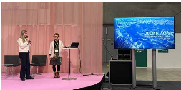
Kaja Beton Radovljican matkailu- ja kulttuurikeskuksesta esittelemässä Juliset Alpit -aluetta messuilla.